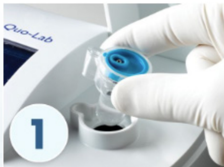
1. Indsæt kassetten i analyseapparatet