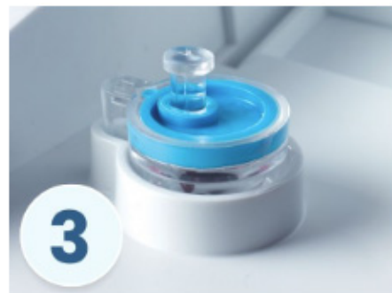
3. Luk låget, resultatet vises indenfor 4 min.